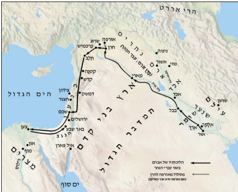
Путь Авраама в Эрец-Кнаан

Разумеется, то, что это "только" драш, еще не означает, что на самом деле Авраам позволял своим рабам служить идолам. Но все же надо постараться не смешивать пшат и драш: Тора здесь хочет подчеркнуть, что, уходя из Харана, они взяли все свое имущество и всех рабов.