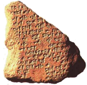
Глиняная табличка с записанными по-аккадски законами Хаммурапи (найдена в Мегидо)

וַתְּדַעַל מֶלֶךְ גּוֹיִם – "и Тида́ля, царя Го́йм (либо "царя множества народов")"; имя תְּדַעַל является распространенным среди ранних хеттских царей, в основном, в форме Tudhaliya. Такое название носила гора, посвященная хеттским божествам.