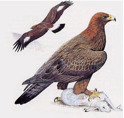
עֵיט – беркут – самая крупная птица из вида орлов ( Aquila chrysaetos ); вверху – молодая птица

Даат микра: עֵיט – самая крупная из хищных птиц, питается также и падалью. Является символом беспредельной жестокости.