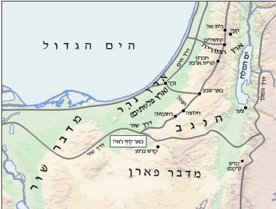
Карта основных путей из Эрец Кнаан в направлении Мицраима

отклонилась так далеко к востоку), либо место к югу от района Ницана (см. Берешит 14, 7). Город בְּרַד не упоминается больше нигде в Танахе. Возможно, его название сохранилось в названии города אל-בְּרַד – набатейского города, который являлся чем-то вроде пригорода Петры. Таргум Эрец Исраэль отождествляет בְּרַד с הַלּוּצָה – городом в 20-ти километрах юго-западнее Беэр-Шевы. В дальнейшем мы узнаем, что Ишмаэль живет в районе Паран ( Берешит 21, 21).