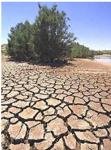
Засуха в Негеве

מִצְרַיִם – "в Мицраим (Египет)". Древнее самоназвание Египта – tawy ("две страны") связано с объединением Верхнего и Нижнего Египта в единую державу около 3000 лет до н.э. Поэтому и ивритское название Египта – מִצְרַיִם ("две страны") 3 – имеет "двойное" окончание, что свидетельствует о его древнем происхождении. Позднее египтяне называли свою страну kmt ( кемет или та-кемет ), что в переводе на русский означает "чёрный" или "чернозём" – из-за плодородной черной земли, которой славился Египет во все свои эпохи. Поэтому в более позднюю эпоху семитские названия Египта уже не имеют двойного окончания: в книгах Йешаяху (19, 6; 37, 25) и Миха (7, 12) Египет называется в единственном числе – מִצֹר. В ассирийских и вавилонских документах Египет называется Musur и Musri. В арабском языке – Misr (в разговорном языке произносится Masr). Принятое в европейских языках название "Египет" происходит от греческого Αἴγυπτος (Айгюптос) – это искаженное "Хикупта" (Хет-Ка-Птах – "дом Ка Птаха"). Это название древней египетской столицы (этот город ныне более известен под названием Мемфис) было перенесено греками на всю страну כִּי לָגַרְנוּ שָׁם – "чтобы пожить там"; основное значение слова לָגַר в Танахе: "временное проживание в чужой стране" ( Даат микра ) כִּי-כָבֵד הָרָעַב בְּאֶרֶץ – "потому что тяжел был голод в той стране (= в Эрец Кнаан)".