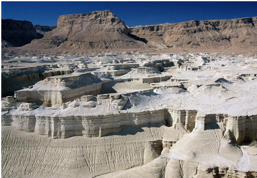
Окрестности Мертвого моря

ומִלְךָ בָּלַע היא-צֶעַר – "и царя города Бѣла, он же Цѣар"; когда встречается такое построение фразы, то сначала приводится древнее название, а потом более современное: בָּלַע – древнее название, а צֶעַר – более позднее. צֶעַר – драша от מְצָעַר ("маленький") (см. Берешит 19, 20).