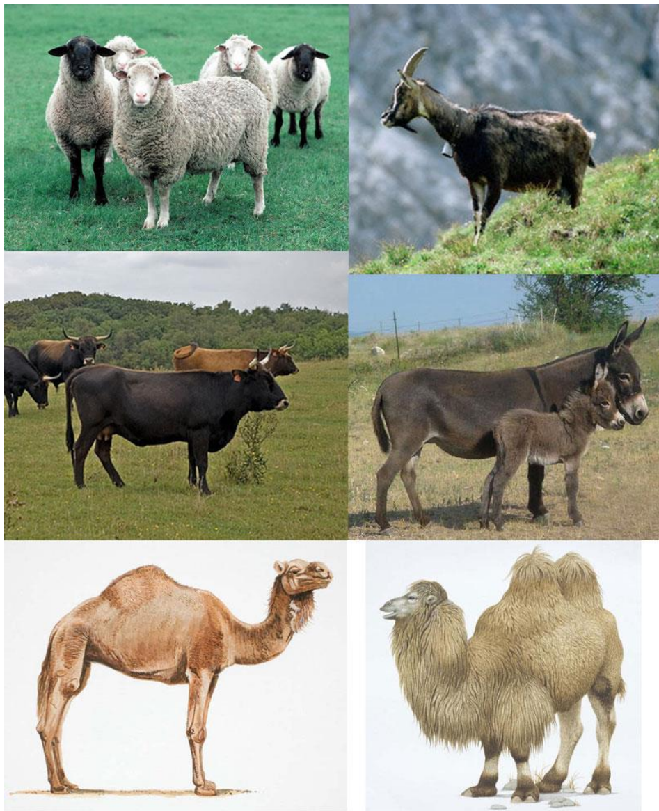
Вверху: צאן – овцы ( Ovis aries ) и козы ( Capra aegagrus hircus ). В центре: בקר – коровы ( Bos taurus ); וְחֲמִירִים... וְאַתְנֵת – ослица с осленком ( Equus asinus ). Внизу: גְּמֵלִים – верблюды: одногорбый ( Camelus dromedarius ) и двугорбый ( Camelus bactrianus )