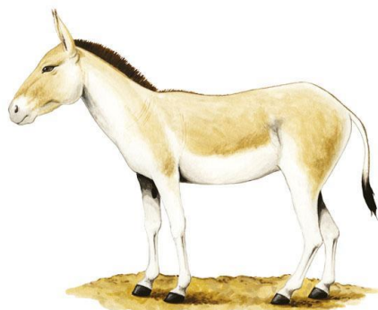
פָּרָא – дикий осел (Equus hemionus)

Утешение для Агари заключается в том, что, несмотря на то, что она сама – рабыня, но ее сын будет свободным человеком (если она покорится госпоже). Из этого противопоставления мы вновь понимаем, что Агар сбежала от Сарай не из-за того, что та издевалась над ней, а из-за того, что не могла вынести изменения своего социального статуса: возвращения из