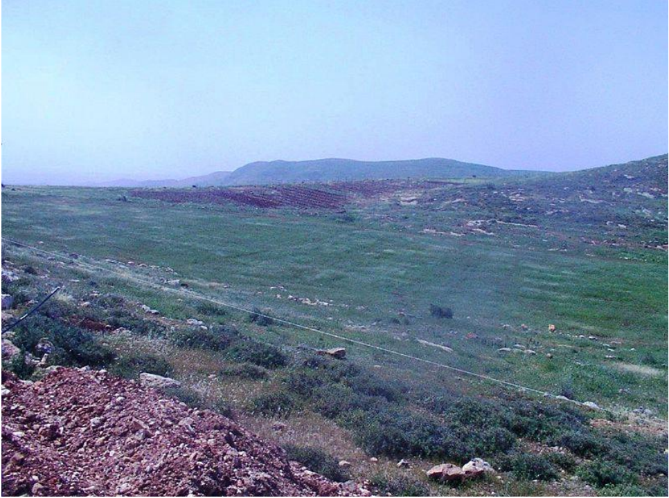
Окрестности Элон Морэ

землю" – у него есть шанс завладеть землей еще при своей жизни. Стоит обратить на это внимание: подобные изменения этих обещаний Тора использует в качестве оценочной шкалы для действий Аврама, и мы также ею воспользуемся для понимания описанных в Торе событий.