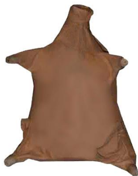
חַמַּת מַיִם – бурдюк

בראשית 16:7 – "в пустыне [в районе] Бээр-Шевы"; "пустыня" здесь – место выпаса скота (см. Берешит 14, 6).