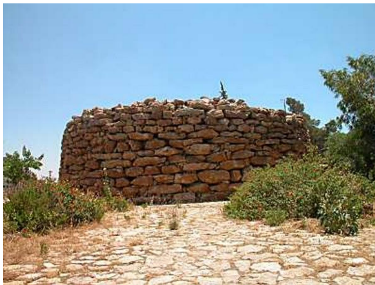
Руины амонитянской крепости в Раббат-Амон

С другой стороны, можно сказать, что для евреев, стоявших у Иордана и готовившихся войти в землю, эта история должна была послужить дополнительным стимулом для укрепления заповеди не дружить с Амоном и Моавом ( Дварим 23, 4-7).