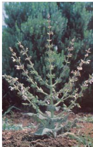
Moria isra'elut (Salvia judaica)

Даат микра: существует много вариантов объяснения происхождения слова מרִיָּה: 1) מֵרֵאָה – "страх перед Всевышним"; 2) אֶמּוֹרֵי – "эморейца"; 3) מְרִיָּה – район, где