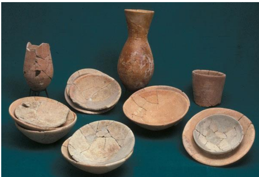
Керамические сосуды (найлены в Бейт-Шеане)

הִנֵּה בְּאֵהָלִי – "да вот здесь, в шатре"; בְּאֵהָלִי – т.е. בְּהֵאֱהָלִי – с определенным артиклем: это все тот же шатер, возле которого Авраам сидел в начале видения.