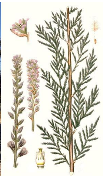
אָשֶׁל – тамариск (Tamarix aphylla)

{פ} (לד) וַיֵּגֶר אַבְרָהָם בְּאֶרֶץ פְּלִשְׁתִּים יָמִים רַבִּים: {פ}