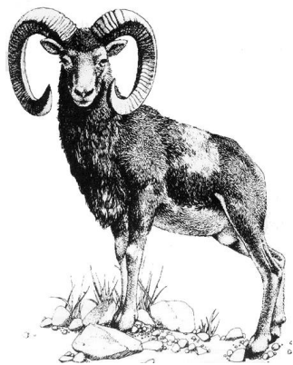
אֵיל – дикий баран ( Ovis orientalis )

Даат микра: еще одно объяснение производит слово אַחַר из выражения в масехет Бава батра (93а): גָּמַל הָאוֹחֵר בֵּין הַגְּמָלִים. Раши там объясняет, что הָאוֹחֵר = "буйствует, взбесился" (затекает драки с другими верблюдами). Тогда фраза приобретает значение: "вот, баран бьется, запутавшись рогами в чаще".