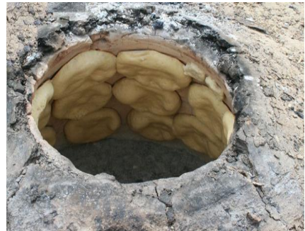
Выпечка лепешек в тануре

קִמַּח סֹלֶת – т.е. "возьми... пшеничной муки и просей солет ": סֹלֶת – это частички,