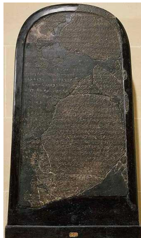
Стелла Меша, царя Моава (см. Млахим 2 3, 4-27)

что связь между отцом и дочерью для неевреев вовсе не является кровосмешением: "Запрет прелюбодеяния для бней Ноах включает в себя шесть частных случаев: половые отношения с матерью, с женой отца, с сестрой по матери, с замужней женщиной, гомосексуализм и скотоложство" ( Мишне Тора, הלכות млахим умильхамот 9, 7). Более того, от сестер происходят два больших народа, что само по себе является в Торе большой наградой – не каждый праведник удостоивается такой высокой чести! Наши мудрецы, хотя и согласны, что это был, вообще говоря, нехороший поступок, при этом говорят, что дочери Лота имели хорошие намерения – выполнить заповедь "плодитесь и размножайтесь", и получили за это награду (см. Талмуд Бавли, масехет хорайот 10б).