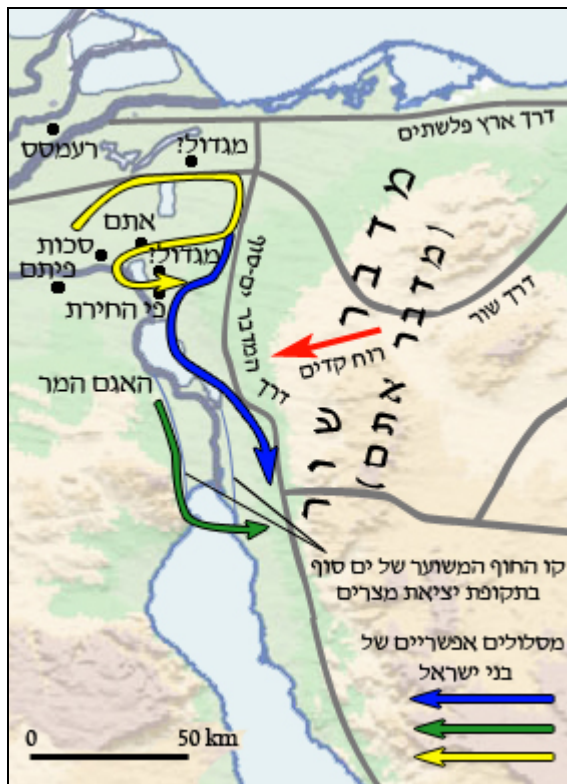
Рис.1. Возможные места перехода через Ям суф.

- условия рельефа местности и морского дна в этом месте должны быть таковы, чтобы сильный восточный ветер, дующий на протяжении всей ночи, был способен сдвинуть достаточно большие объемы воды 2 .